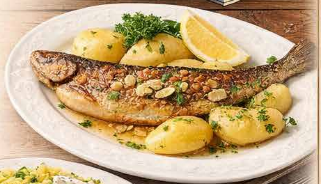
Gebratene Forelle in Mandelbutter mit Kartoffeln