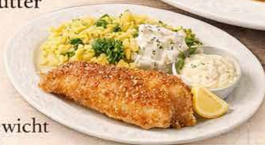
Gebackene Forelle mit Kartoffelsalat