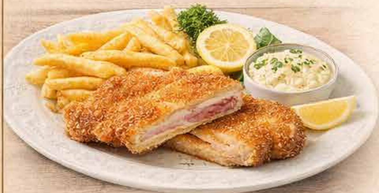
Gebackenes Seelachsfilet mit Kartoffelsalat & Remoulade